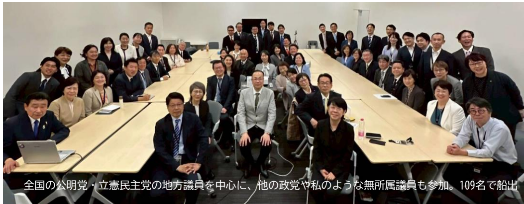
全国の公明党・立憲民主党の地方議員を中心に、他の政党や私のような無所属議員も参加。109名で参加